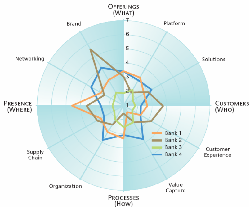
Abb. 2: Das Innovationsradar für 4 Banken im Vergleich